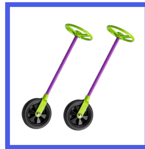
Чудо-колесо – 2 шт Артикул 63032