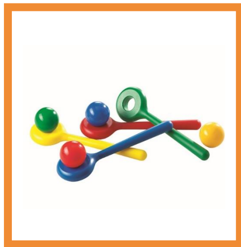
Игровой набор «Поймай шарик» – 1 шт Артикул 63042