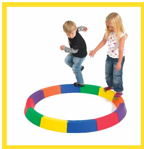
Дорожка балансирующая «Радуга» – 1 шт