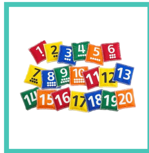
Мешочки с цифрами (набор 20 шт) – 1 шт Артикул 61074